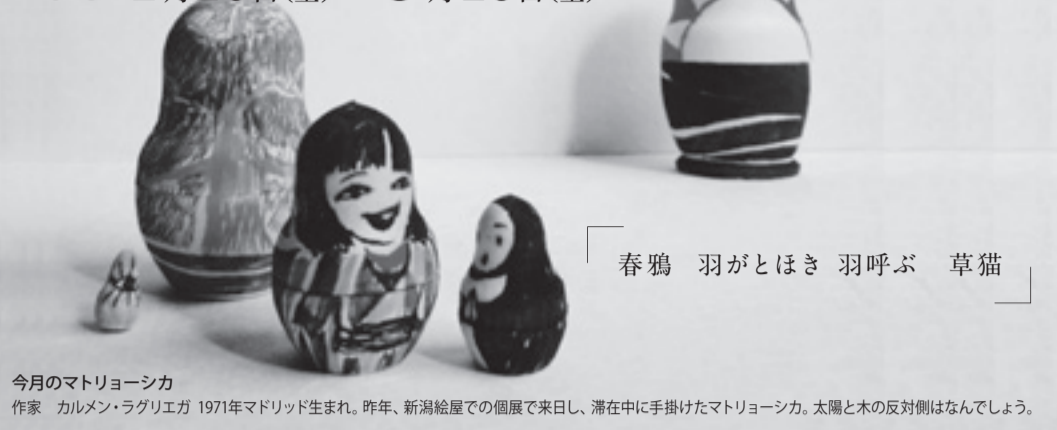
春鴉 羽がとほき 羽呼ぶ 草猫

今月のマトリョーシカ 作家 カルメン・ラグリエガ 1971年マドリッド生まれ。昨年、新潟絵屋での個展で来日し、滞在中に手掛けたマトリョーシカ。太陽と木の反対側はなんでしょう。